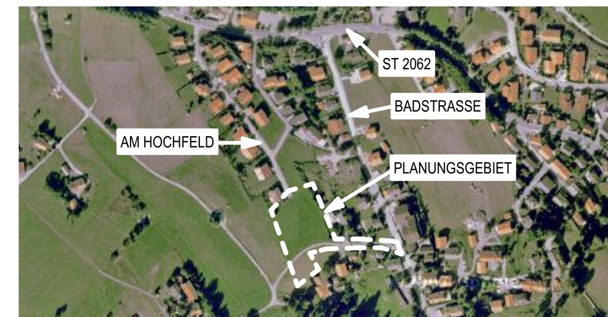
ÜBERSICHTSLAGEPLAN M 1:5000

Aufstellungsbeschluss am ..... Öffentliche Auslegung gem. §3 Abs. 2 BauGB gleichzeitig mit der Einholung der Stellungnahmen der Behörden und der sonstigen Träger öffentlicher Belange gem. §4 Abs. 2 BauGB, beides in Verb. m. § 13, § 13a u. b BauGB vom ..... bis ..... Erneute öffentliche Auslegung gem. §3 Abs. 2 BauGB gleichzeitig mit der Einholung der Stellungnahmen der Behörden und der sonstigen Träger öffentlicher Belange gem. §4 Abs. 2 BauGB, beides in Verb. m. § 13, § 13a u. b BauGB vom ..... bis ..... Satzungsbeschluss nach § 10 Abs. 1 BauGB am ..... Bad Kohlgrub, den ..... 1. Bürgermeister Ortsübliche Bekanntmachung gem. §10 Abs. 3 Satz 1 BauGB am ..... Der Bebauungsplan mit Begründung wird seit diesem Tag zu den üblichen Dienststunden im Rathaus zu jedermanns Einsicht bereitgehalten. Über den Inhalt wird auf Verlangen Auskunft erteilt. Mit der Bekanntmachung tritt der Bebauungsplan in Kraft. Auf die Rechtsfolgen der §§ 44, 214 und 215 BauGB wurde hingewiesen. Bad Kohlgrub, den ..... 1. Bürgermeister